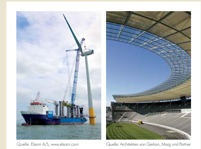
Grafik 3 Einsatzbereiche für unsere individuelle WETTERBERATUNG

■ Unsere zuverlässigen und aktuellen Informationen werden bereits bei der Planung und dem Betrieb von On- und Offshore-Windparks, von Energieversorgungs- und Energiehandelsunternehmen, in der Versicherungsbranche, im Formel 1 Rennbetrieb sowie bei Ausstellungen und sonstigen Großveranstaltungen genutzt ( Grafik 3 ).